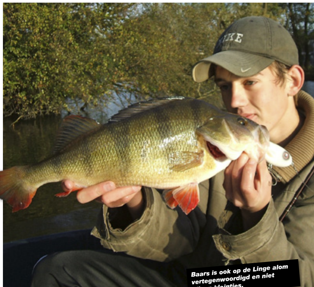
Baars is ook op de Linge alom vertegenwoordigd en niet alleen kleintjes.

waar de rivier via een sluis in de Merwede uit komt. De Linge zelf stroomt overigens zelden. Wanneer ze dat wel doet, kun je beter een ander water opzoeken: een stromende Linge betekent een troebele Linge en dat betekent doorgaans een heel taai visdag!