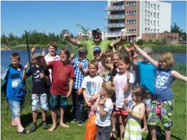
Houten, AUHV jeugddag 2012