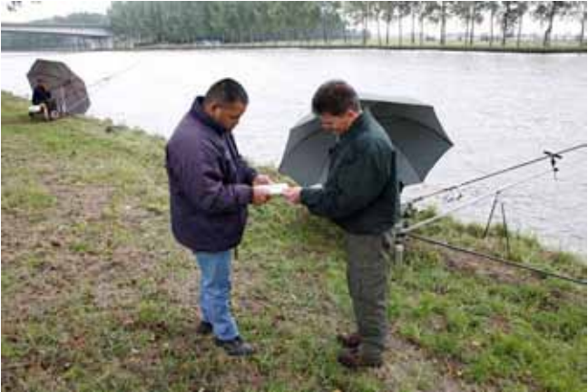
Controle visdocumenten

Het bestuur van de AUHV laat zo vaak als mogelijk controleren door verenigingscontroleurs, BOA's en Politie.