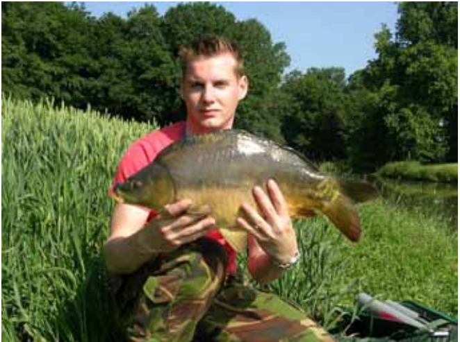
Kromme Rijn, karp 44cm, 8 pond (S. v.d. Greef)